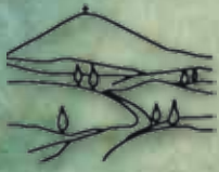
Unione dei comuni Amiata Val d'Orcia