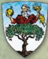
Comune di Abbadia S.S.