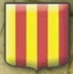
Comune di San Quirico d'Orcia